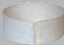
PRÉFILTRE LOT DE 10