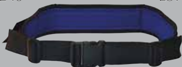
CEINTURE DE CONFORT